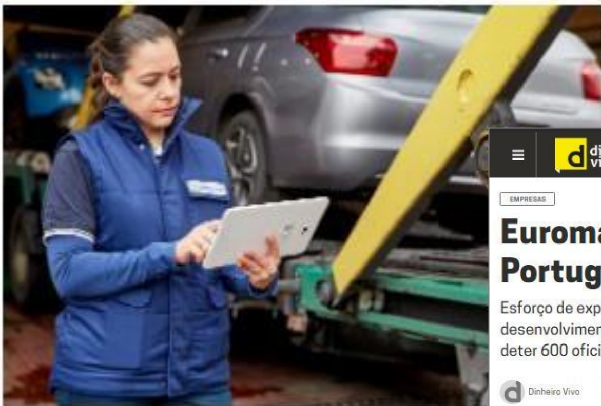
Euromaster prevê chegar às 100 oficinas em Portugal até 2026