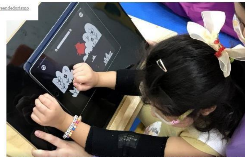
Um dos vencedores do concurso Banco Montepio Acredita Portugal analisou 10.620 ideias na 11ª edição da iniciativa. A TechTale foi uma das vencedoras.

A 11ª edição do concurso Banco Montepio Acredita Portugal selecionou seis iniciativas entre mais de dez mil ideias recebidas. Os