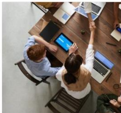
"Women on Boards" chega nos dias 9, 10, 11, 24 e 25 de março, à Escola de Negócios da Universidade do Porto

Home / Empresas / Empreendedorismo / Acredita Portugal já