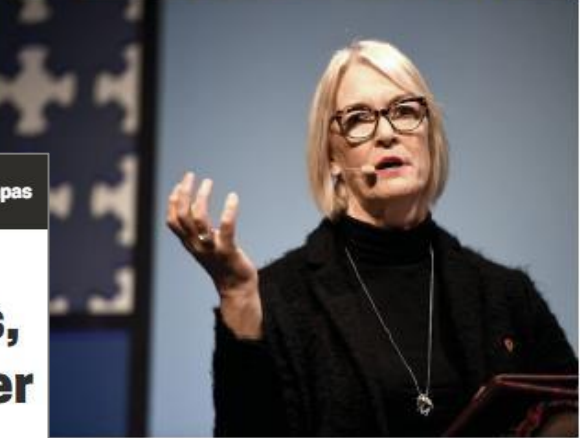
uma britânica falou da importância de salvaguardar as crianças

JOÃO MONIZ jmoniz@destak.pt A longo dos próximos quatro anos, a venda de bens de grande consumo (BGC na sigla em inglês) vai au-